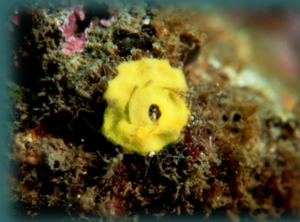
Posta d'ous d'una Tylodina perversa