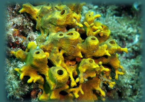
Les esponges Aplysina sp. tenen una coloració daurada y tenen formes tubulars