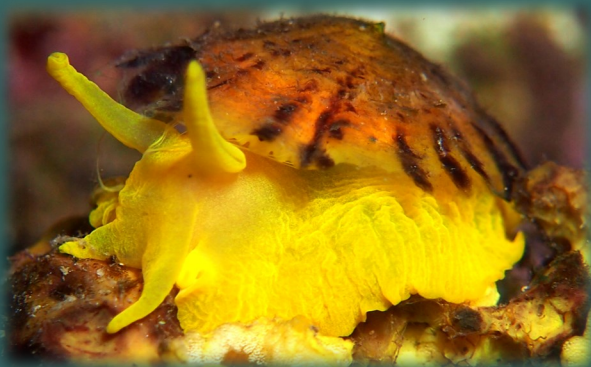
Tylodina perversa en el seu hàbitat

Mentre s'alimenta d' Aplysina , la Tylodina incorpora, en el seu cos i les seves postes, pigments grocs de l'esponja i compostos químics d'aquestes per a camuflar-se i defensar-se!